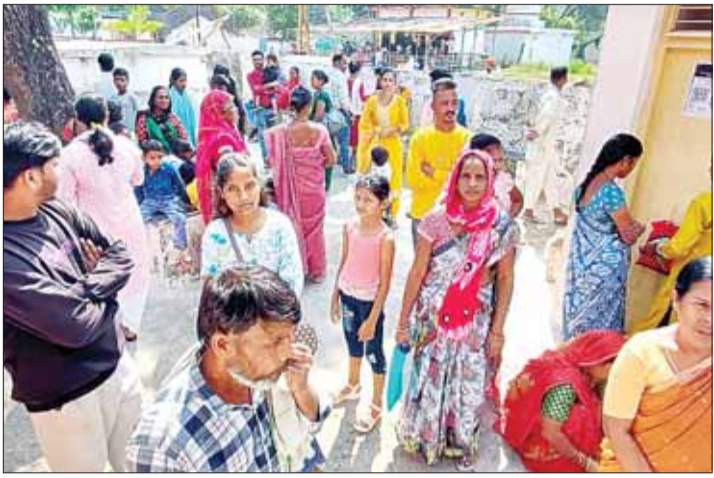
जबलपुर। सेंट्रल जेल में माई दूज पर्व पर सामूहिक रूप से माई दूज मनाया जा रहा है, जहाँ पर मुलाकात होती है वहाँ पर कैदियों के प्रेजेन्ट द्वारा फोन से बात करके मेल जोल कराया गया।

अलग से जेल प्रशासन द्वारा व्यवस्थाएं की गई थीं। किसी की आंखों में चारदीवारी के अंदर की घुटन झलक रही थी, तो माईयों को बंदी की शक्त में देख बहनों की आंखें भी छलछला आईं। माई दूज के पर्व के साथ ही पांच दिवसीय दीपोत्सव पर्व का हर्षोल्लास के साथ समापन हो गया। माई दूज के पर्व को लेकर ऐसी मान्यता है कि यम की बहन यमुना के घर आज के दिन यमराज ने जाकर टीका लगवाया था। यमराज ने प्रसन्न होकर बहन को अनेक प्रकार की भेंट प्रदान की। बहन के वर मांगने पर यमराज ने कहा कि आज के दिन जो बहन अपने माई को घर बुलाकर टीका कर उसे भोजन कराएगी, उसके माई की हमेशा रक्षा रहेगी, इसलिए इस त्यौहार को यम द्वितीया भी कहा जाता है।